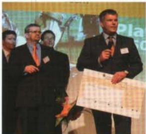
Strahlende Sieger sind das Team der Xmail AG