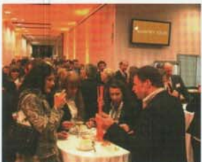
Orange-farbenes Licht zaubert Atmosphäre bei Catering